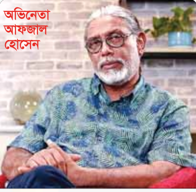
অভিনেতা আফজাল হোসেন

সেই সত্তর সালে পারুলিয়া থেকে ঢাকায় আসতে পুরো দিন লেগেছিল। অর্ধশত বছরের বেশি একই রকম কেটেছে। পদ্মা সেতু বদলে দিয়েছে পুরানো হিসাব। ঢাকা থেকে পারুলিয়ার দূরত্ব এখন কমে অর্ধেকটা। ভায়ে বেরিয়ে দুপুরের শুরুতে বাড়ি পৌঁছে গেছি।