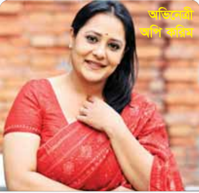
অভিনেত্রী অপূর্ণা করিম

সেই সত্তর সালে পারুলিয়া থেকে ঢাকায় আসতে পুরো দিন লেগেছিল। অর্ধশত বছরের বেশি একই রকম কেটেছে। পদ্মা সেতু বদলে দিয়েছে পুরানো হিসাব। ঢাকা থেকে পারুলিয়ার দূরত্ব এখন কমে অর্ধেকটা। ভায়ে বেরিয়ে দুপুরের শুরুতে বাড়ি পৌঁছে গেছি।