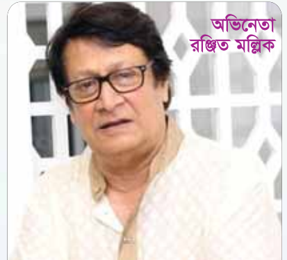
অভিনেতা রঞ্জিত মল্লিক

আমি নিজের মতো করে বাঁচতে ভালোবাসি। এত বছর অভিনয় করে এখনো ভাড়া বাড়িতে থাকি। সেটা স্বীকার করতে আমার লজ্জা নেই। ভাড়া বাড়ির প্রতিটি জিনিস পরিশ্রমের টাকায় কেনা। অন্যের কাছ থেকে বিলাসবহুল গাড়ি আর ফ্ল্যাট উপহার নেওয়ার চেয়ে এ জীবনটা অনেক ভালো।