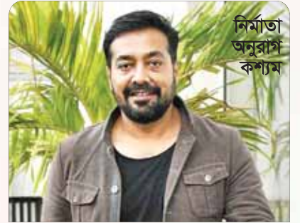
নির্মাতা অনুরাগ কশ্যপ

জনপ্রিয়তা পাওয়ার জন্য রিলস বানানো আমার পক্ষে সম্ভব নয়। ইনস্টাগ্রাম ফলোয়ার দিয়ে এখন অনেক কিছু বিচার করা হয় ঠিকই। তাই বলে সারাদিন কী করছি, কী খাচ্ছি— এসব পোস্ট করতে পারব না। টালিউডে এ ট্রেন্ডটা বেশি, মুম্বাইয়ের প্রথম সারির অভিনেতারা এসব করেন না।