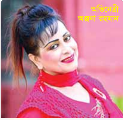
অভিনেত্রী অঞ্জনা রহমান

জীবিত থাকা অবস্থায় জাতীয় চলচ্চিত্র পুরস্কারে ভূষিত করা না হলে, মৃত্যুর পর মরণোত্তর পুরস্কার আমার চাই না। তাই সরকারের কাছে চলচ্চিত্র পরিবারের পক্ষ থেকে আমার বিনীত অনুরোধ, মরণোত্তর আজীবন সম্মাননা পুরস্কার বন্ধ করা হোক।