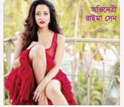
অভিনেত্রী রাইমা সেন

জনপ্রিয়তা পাওয়ার জন্য রিলস বানানো আমার পক্ষে সম্ভব নয়। ইনস্টাগ্রাম ফলোয়ার দিয়ে এখন অনেক কিছু বিচার করা হয় ঠিকই। তাই বলে সারাদিন কী করছি, কী খাচ্ছি— এসব পোস্ট করতে পারব না। টালিউডে এ ট্রেন্ডটা বেশি, মুম্বাইয়ের প্রথম সারির অভিনেতারা এসব করেন না।