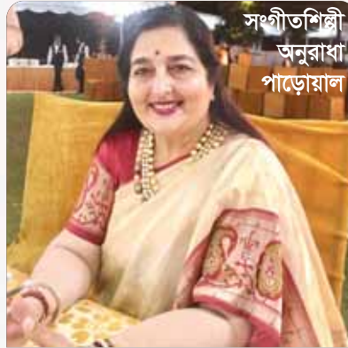
সংগীতশিল্পী অনুরাধা পাড়োয়াল

আমি নিজেই গান খুব একটা শুনি না। কিন্তু মাঝে মাঝে শুনেই হয়। বিশেষ করে আমার গাওয়া ভক্তীগীতিগুলো শুনি। কেন জানেন? রিমিক্স গান শুনে এতটাই আঁতকে উঠি, চোখে জল চলে আসে। সেই হতাশা থেকে বেরুতে দ্রুত নিজের গানগুলো চালিয়ে দিই। তারপর স্বস্তি পাই।