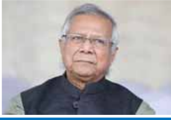
ড. মুহাম্মদ ইউনুস